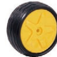
NAME:6" 汽车轮 ITEM NO:XH6012 SIZE:158*61 配套 :6" 备注 :反面无刹车齿 客户专用