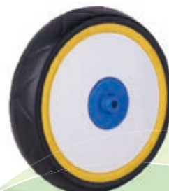
NAME:11" 驱动轮 ITEM NO:XH1107 SIZE:278*66 配套:9"11" 备注:双面轮 客户专用