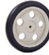
NAME:6" 五孔轮 ITEM NO:XH6031 SIZE:153*22 配套:6"7" 备注:反面带刹车齿 客户专用