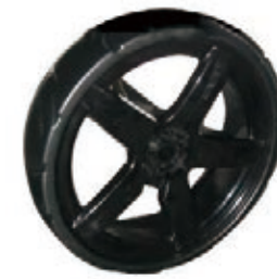
NAME:10" F2 后窄轮 ITEM NO:XH1014 SIZE:248*80 配套:5.5*10" 备注:反面无刹车齿,可配辅助齿,快拆,轮盖 客户专用