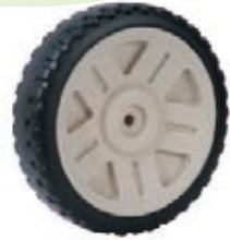
NAME:8" 吉普轮 ITEM NO:XH8022 SIZE:197*51 配套:8".10" 备注:反面无刹车齿