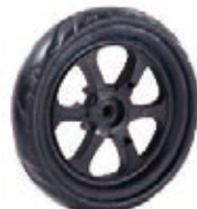
NAME:7" 瘦轮 ITEM NO:XH7006 SIZE:171*34 配套:7" 备注:反面带刹车齿,带轮盖