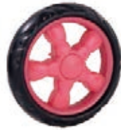
NAME:6" 风火娃娃轮 ITEM NO:XH6020 SIZE:150*34 配套:6",7" 备注:反面无刹车齿