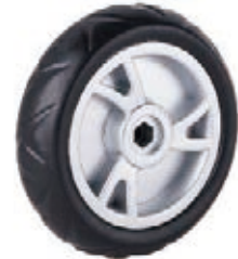
NAME:9" 蟹脚轮 ITEM NO:XH9015 SIZE:226*61 配套:7"9" 备注:双面轮 客户专用