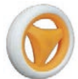
NAME:4.5" 飞力轮 ITEM NO:XH4504 SIZE:109*22 配套:配套:4.5" 备注:反面无刹车齿