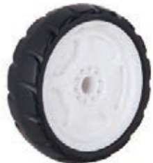
NAME:9"ST 轮 ITEM NO:XH9013 SIZE:222*64 配套:8"9" 备注:双面轮 客户专用