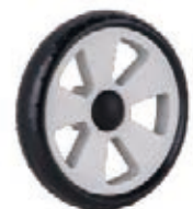
NAME:6.5" 叶片轮 ITEM NO:XH6518 SIZE:162*31 配套:6.5" 备注:反面带刹车齿