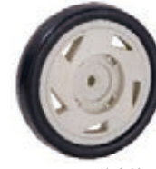
NAME:5.5" 旋立轮 ITEM NO:XH5508 SIZE:136*27 配套:5.5" 备注:反面带刹车齿 客户专用