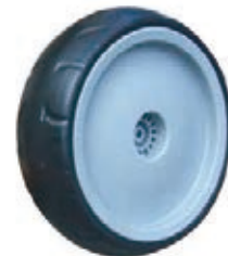
NAME:9" 柳纹轮 ITEM NO:XH9003 SIZE:234*72 配套:7"9" 备注:双面轮 客户专用