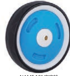
NAME:10" 家宝轮 ITEM NO:XH1042 SIZE:250*60 配套:8"10" 备注:双面轮 客户专用