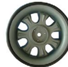
NAME:12" 大S轮 ITEM NO:XH1207 SIZE:255*85 配套:6*12" 备注:反面无刹车齿