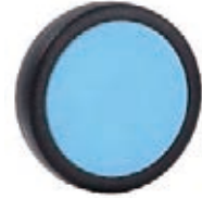
NAME:6" 新娃娃轮 ITEM NO:XH6016-2 SIZE:148*35 配套:6" 备注:反面带刹车齿