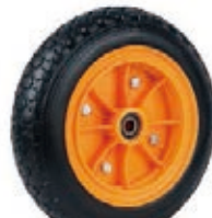
NAME:8" 橡胶轮 ITEM NO:XH8016 SIZE:216*65 配套:8"10"12" 备注:双面轮,配轴承,轮盖