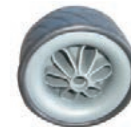
NAME:6" 小S轮 ITEM NO:XH6018 SIZE:143*75 配套:6*12" 备注:双面轮,可配轴承