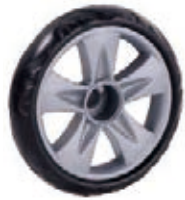
NAME:7" 贝丽风火轮 ITEM NO:XH7026 SIZE:172*34 配套:6",7" 备注:反面无刹车齿,可配快拆