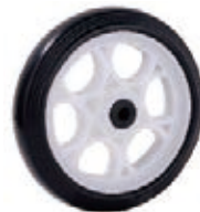
NAME:7.2" 机械轮 ITEM NO:XH7030 SIZE:183*41 配套:7.2*9.65" 备注:双面轮,带轴套 客户专用