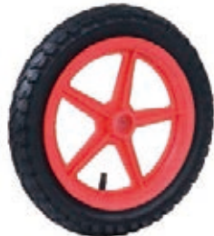
NAME:12" 五星充气轮 ITEM NO:XH1204 SIZE:304*48 配套:12" 备注:双面轮,可配轴承