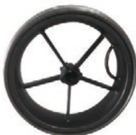
NAME:11" 五幅轮 ITEM NO:XH1104 SIZE:279*82 配套:11" 备注:双面轮,客户专用