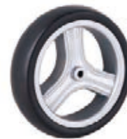
NAME:6.5" 三菱轮 ITEM NO:XH6511 SIZE:163*39 备注:双面轮