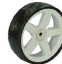
NAME:10"105P3 后轮 ITEM NO:XH1031 SIZE:253*88 配套:5.5*10" 备注:反面无刹车齿,配