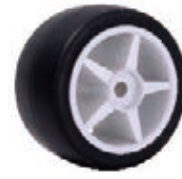
NAME:5.5" F2 前轮 ITEM NO:XH5507 SIZE:139*76 配套:5.5*10" 备注:双面轮 客户专用