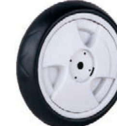
NAME:11" 至尊轮 ITEM NO:XH1106 SIZE:262*64 配套:9"11" 备注:双面轮 客户专用