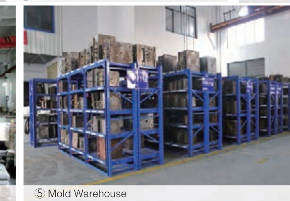
⑤ Mold Warehouse