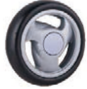
NAME:5.75" 螺旋桨轮 ITEM NO:XH5513 SIZE:134*26 配套:5.75" 备注:反面带刹车齿 客户专用