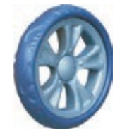
NAME:6" 贝思风火轮 ITEM NO:XH6008 SIZE:150*34 配套: 6",6.5" 备注: 反面带刹车齿