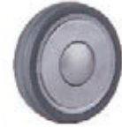
NAME:5" 福字平面轮 ITEM NO:XH5007 SIZE:125*30 配套:5" 备注:反面带刹车齿 客户专用