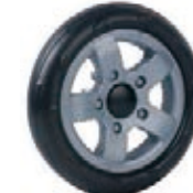
NAME:6" 贝驰轮 ITEM NO:XH6024-1 SIZE:152*32 配套:6" 备注:反面带刹车齿