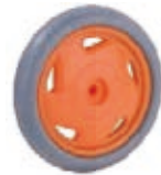
NAME:4.5" 猫眼轮 ITEM NO:XH4507 SIZE:110*22 配套:4.5" 备注:反面带刹车齿