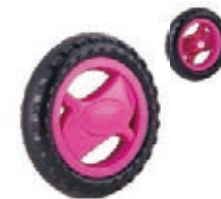
NAME:5.5" X轮 ITEM NO:XH5505 SIZE:140*32 配套:5.5",6",7.5" 备注:反面无刹车齿