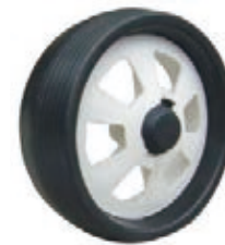
NAME:10" 美克轮 ITEM NO:XH1002 SIZE:250*87 配套:5*10" 备注:反面无刹车齿,带快拆