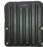
NAME:永吉靠背 ITEM NO:XH0006 SIZE:300