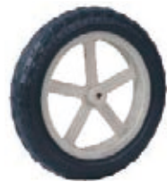
NAME:8" 五柱轮 ITEM NO:XH8025 SIZE:205*39 配套:5.5*8" 备注:双面轮