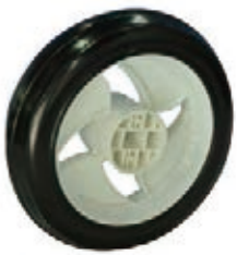
NAME:8.2" 四叶轮 ITEM NO:XH8028 SIZE:212*56 配套:7.2"8.2" 备注:双面轮 客户专用