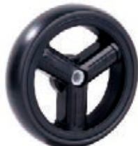
NAME:7" 三柱后轮 ITEM NO:XH7028 SIZE:182*42 备注: 单面轮, 反面无刹车齿需配辅助齿