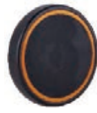
NAME:5" 平面盖轮 ITEM NO:XH5016 SIZE:125*30 配套:5",6.5" 备注:反面带刹车齿