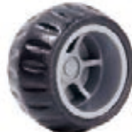
NAME:4" 月牙轮 ITEM NO:XH4004 SIZE:96*45 配套 :3",4" 备注 :反面无刹车齿 客户专用