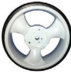
NAME:10" 三奥轮 ITEM NO:XH1036 SIZE:254*88 配套:10" 备注:反面无刹车齿,可配快拆及轮盖 客户专用