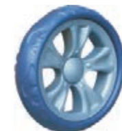
NAME:6.5" 贝思风火轮 ITEM NO:XH6503 SIZE:165*34 配套: 6",6.5" 备注: 反面带刹车齿