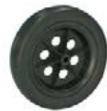
NAME:4.5" 联动轮 ITEM NO:XH4513 SIZE:112*24 配套:4.5" 备注:双面轮