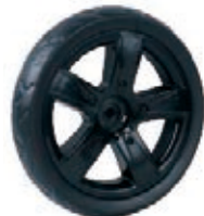
NAME:7" 贝嘉轮 ITEM NO:XH7024 SIZE:173*35 配套: 6",7" 备注: 反面带刹车齿