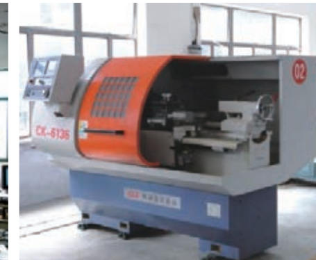
② Mold Manufacture Center