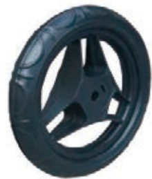
NAME:10" 中华胎 ITEM NO:XH1004 SIZE:252*41 配套:10" 备注:双面轮