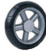
NAME:7.5" 水车轮 ITEM NO:XH7503 SIZE:192*47 配套:6.5"7.5" 备注:反面带刹车齿