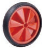
NAME:5" 扇叶轮 PVC ITEM NO:XH5002 SIZE:126*28 配套:5"6" 备注:双面轮,可配轴卡