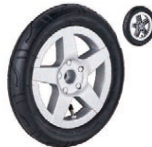
NAME:12" 思明轮 ITEM NO:XH1225 SIZE:306*52 配套:6",12" 备注:反面无刹车齿, 可配辅助齿,快拆.