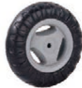
NAME:6" 宝石轮 ITEM NO:XH6029 SIZE:153*35 配套:6" 备注:反面带刹车齿