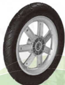
NAME:12" 导瑞轮 ITEM NO:XH1223 SIZE:304*52 配套:12" 备注:反面无刹车齿,可配辅助齿,快拆 客户专用