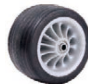
NAME:5.5" 电动车轮 ITEM NO:XH5506 SIZE:143*73 配套:5.5" 备注:双面轮,可配轴承