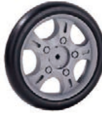
NAME:8" 宾菱轮 ITEM NO:XH8011 SIZE:202*39 配套:7"8" 备注:反面带刹车齿