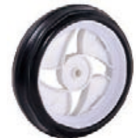
NAME:7.2" 四叶轮 ITEM NO:XH7031 SIZE:186*50 配套:7.2"8.2" 备注:反面无刹车齿 客户专用