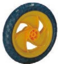
NAME:8" 三旋轮 ITEM NO:XH8008 SIZE:206*46 配套:8"10" 备注:反面无刹车齿