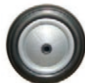
NAME:5" 平面轮 ITEM NO:XH5004 SIZE:130*28 配套:5" 备注:反面无刹车齿,配轴卡