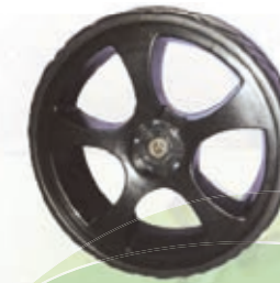
NAME:10" F2 新轮 ITEM NO:XH1040 SIZE:254*49 配套:5.5*10" 备注:反面无刹车齿,可配辅助齿,快拆,轮盖 客户专用