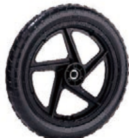
NAME:14" 越野轮 ITEM NO:XH1401 SIZE:352*46 配套:14"16" 备注:可做双面轮,配轴套,轴承,可配充气胎