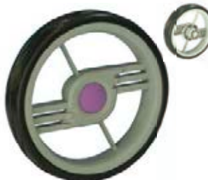
NAME:10" 幻影轮 ITEM NO:XH1038 SIZE:254*49 配套:7",10" 备注:反面无刹车齿 客户专用