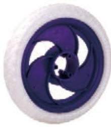
NAME:10" 三旋轮 ITEM NO:XH1009 SIZE:250*52 配套:8"10" 备注:双面轮