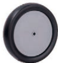
NAME:7.5" 平板轮 ITEM NO:XH7502 SIZE:182*36 配套:7.5" 备注:反面无刹车齿