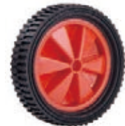
NAME:6" 扇叶大黑轮 ITEM NO:XH6022 SIZE:148*34 配套:5"6" 备注:双面轮,可配轴卡