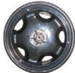
NAME:10" 单拨后轮 ITEM NO:XH1012 SIZE:252*87 配套:10" 备注:反面无刹车齿 客户专用