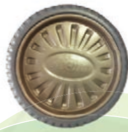
NAME:9.8" 通利轮 ITEM NO:XH1034 SIZE:250*39 配套:9.8" 备注:反面无刹车齿 客户专用