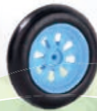
NAME:4.5" 百合中胖轮 ITEM NO:XH4517 SIZE:114*29 配套:4.5" 备注:反面带刹车齿