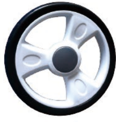
NAME:9" 三博轮 ITEM NO:XH9010 SIZE:229*43 配套:8",9" 备注:反面带刹车齿