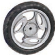
NAME:6" 元宝轮 ITEM NO:XH6026 SIZE:154*30 配套:6" 备注:反面带刹车齿