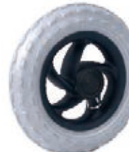
NAME:8" 越野轮 ITEM NO:XH8006 SIZE:210*40 配套:6"8" 备注:反面可带刹车齿,可配辅助齿,配快拆