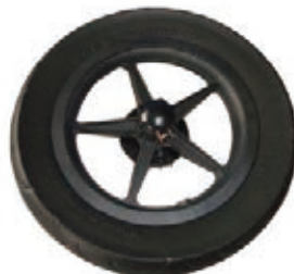
NAME:12" 可利奥轮 ITEM NO:XH1215 SIZE:266*48 配套:12" 备注:可做双面轮,可配辅助齿,轴承,快拆