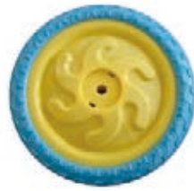
NAME:8" 启乐轮 ITEM NO:XH8010 SIZE:206*46 配套:8"10" 备注:反面无刹车齿