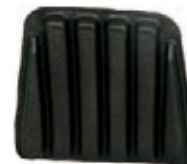
NAME:小靠背 ITEM NO:XH0002 SIZE:285*325