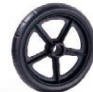
NAME:7" 五星轮 ITEM NO:XH7013 SIZE:180*34 配套:7"8"12" 备注:双面轮,可配轴承