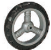
NAME:4.5" 三管轮 ITEM NO:XH4523 SIZE:114*23 配套:4.5" 备注:双面轮