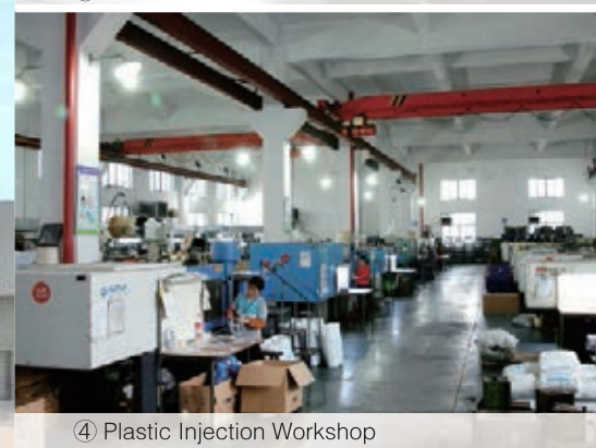
④ Plastic Injection Workshop