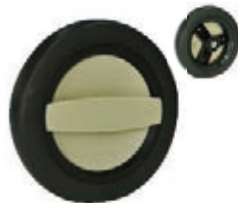
NAME:6.5" 银龙轮 ITEM NO:XH6513 SIZE:163*30 配套:6.5" 备注:反面无刹车齿