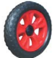
NAME:7" 贝思轮 ITEM NO:XH7004 SIZE:175*34 配套: 7" 备注: 反面带刹车齿