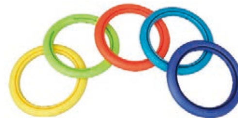
NAME:12" 发泡盘 NO:XH1221 SIZE:300 配套:12"16"