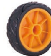
NAME:6" 实芯轮 ITEM NO:XH6051 SIZE:158*45 配套 :6" 备注 :双面轮 客户专用