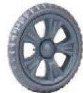
NAME:6" 贝思宝石轮 ITEM NO:XH6009 SIZE:151*30 配套: 6",6.5",7" 备注: 反面带刹车齿