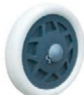
NAME:7" 行李轮 ITEM NO:XH7008 SIZE:172*31 配套:7" 备注:反面无刹车齿,带快拆