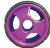
NAME:7" 三幅柳纹轮 ITEM NO:XH7012 SIZE:173*70 配套:7"9" 备注:反面无刹车齿 客户专用