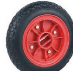
NAME:10" 方孔橡胶轮 ITEM NO:XH1019 SIZE:258*79 配套:8"10"12" 备注:双面轮,轮盖