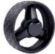
NAME:8" 包胶轮 ITEM NO:XH8013 SIZE:206*73 配套:8"10" 备注:反面无刹车齿,可配快拆,轮盖