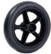
NAME:6" 五星轮 ITEM NO:XH6043 SIZE:148*29 配套:6" 备注:双面轮 客户专用