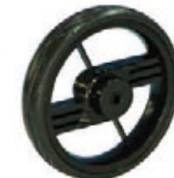
NAME:7" 幻影1#轮 ITEM NO:XH7032 SIZE:174*33 配套:7",10" 备注:双面轮 客户专用