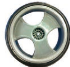
NAME:9" 三幅柳纹轮 ITEM NO:XH9011 SIZE:234*72 配套:7"9" 备注:双面轮 客户专用