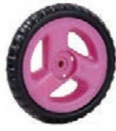
NAME:6" 吉利轮 ITEM NO:XH6013 SIZE:152*30 配套:6",6.5",7" 备注:反面无刹车齿,可配快拆