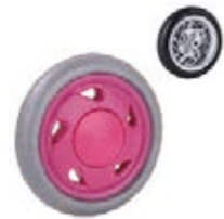
NAME:4.5" 平车轮 ITEM NO:XH4509 SIZE:109*23 配套:4.5" 备注:反面无刹车齿