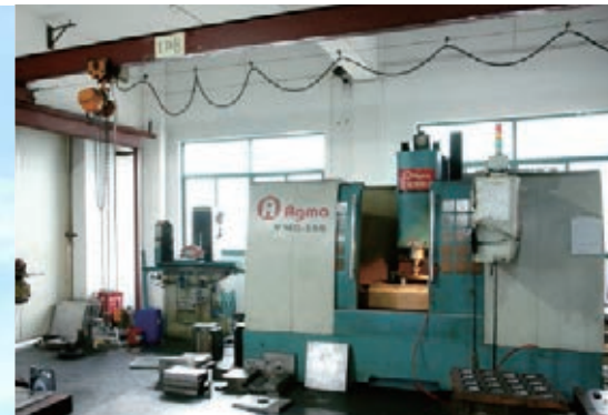
① Mold Manufacture Center