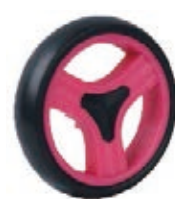
NAME:6" 三菱轮 ITEM NO:XH6044 SIZE:144*34 备注:反面带刹车齿