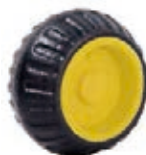
NAME:4" 卡车轮 ITEM NO:XH4001 SIZE:92*45 配套 :4" 备注 :双面轮 客户专用