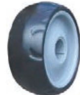
NAME:7" 柳纹轮 ITEM NO:XH7012 SIZE:173*70 配套:7"9" 备注:反面无刹车齿 客户专用