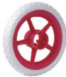
NAME:10" 五星轮 ITEM NO:XH1033 SIZE:256*51 配套:10" 备注:双面轮,可配轮盖