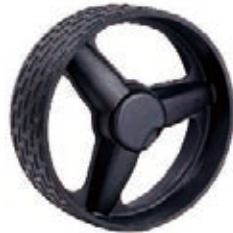
NAME:10" 包胶轮 ITEM NO:XH1017 SIZE:256*88 配套:8"10" 备注:反面无刹车齿,可配快拆,轮盖