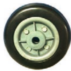
NAME:8" 威弘轮 ITEM NO:XH8030 SIZE:202*60 配套:8" 备注:双面轮 客户专用