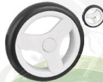
NAME:11" T08 前轮 ITEM NO:XH1110 SIZE:276*54 配套:8",10" 备注:反面无刹车齿,可配 辅助齿 客户专用