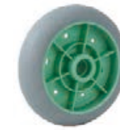
NAME:6" 海娜轮 ITEM NO:XH6048 SIZE:160*43 配套 :6" 备注 :双面轮,带轮盖