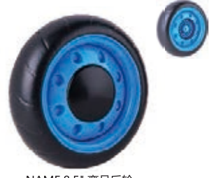
NAME:8.5" 弯月后轮 ITEM NO:XH8505 SIZE:216*44 配套:8.5"前,8.5"后 备注:反面无刹车齿 客户专用