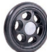
NAME:6" 宾士轮 ITEM NO:XH6049 SIZE:145*21 配套:6"7" 备注:反面带刹车齿 客户专用