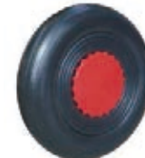
NAME:6" 法国轮 ITEM NO:XH6003 SIZE:150*34 配套:6" 备注:反面带刹车齿