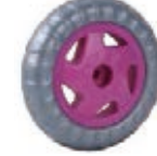
NAME:5.5" 旋风轮 ITEM NO:XH5501 SIZE:136*30 配套:5.5" 备注:反面带刹车齿