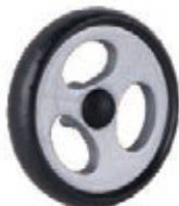
NAME:6.5" 三孔轮 ITEM NO:XH6517 SIZE:162*31 配套:6.5" 备注:反面带刹车齿