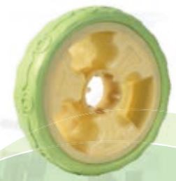
NAME:10" 太阳轮 ITEM NO:XH1025 SIZE:250*61 配套:9"10" 备注:双面轮