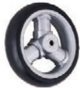
NAME:5.5" 三柱轮 ITEM NO:XH5509 SIZE:141*35 配套: 5.5",6",7" 前,7" 后, 10" 备注: 双面轮