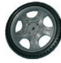
NAME:7" 宾菱轮 ITEM NO:XH7018 SIZE:180*32 配套:7"8" 备注:反面带刹车齿