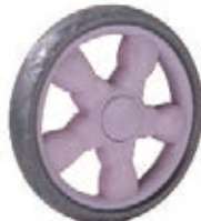
NAME:7" 风火轮 ITEM NO:XH7002 SIZE:173*34 配套:6",7" 备注:反面带刹车齿