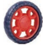
NAME:5" 梅花轮 ITEM NO:XH5001 SIZE:126*25 配套:5" 备注:反面带刹车齿