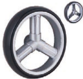
NAME:10" 三柱轮 ITEM NO:XH1027 SIZE:262*52 备注: 单面轮, 反面无刹车齿需配辅助齿