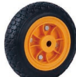
NAME:12" 橡胶轮 ITEM NO:XH1214 SIZE:295*77 配套:8"10"12" 备注:双面轮,配轴承,轮盖 客户专用