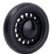
NAME:6" 风叶轮 ITEM NO:XH6036 SIZE:149*34 配套:6" 备注:反面带刹车齿