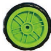
NAME:5" 笑脸轮 ITEM NO:XH5011 SIZE:132*34 配套 :5" 备注 :双面轮 客户专用