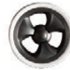
NAME:5" 杏叶轮 ITEM NO:XH5014 SIZE:127*29.5 配套:5" 备注:反面带刹车齿