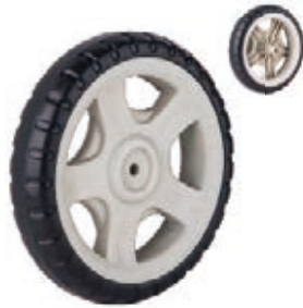
NAME:10" 吉普轮 ITEM NO:XH1039 SIZE:252*49 配套:8".10" 备注:反面无刹车齿