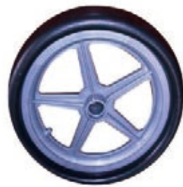
NAME:10.5" 五星跑车轮 ITEM NO:XH1105 SIZE:266*65 配套:10.5" 备注:双面轮,可配轴承