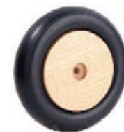
NAME:6" 木星胖轮 ITEM NO:XH6047 SIZE:142*43 配套 :6" 备注 :双面轮