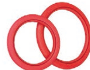
NAME:16" 发泡盘 NO:XH1602 SIZE:406 配套:12"16"