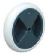
NAME:5.5" 行李轮 ITEM NO:XH5002 SIZE:139*31 配套:5.5" 备注:双面轮