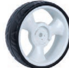
NAME:10" 金奥轮 ITEM NO:XH1035 SIZE:254*88 配套:10" 备注:反面无刹车齿,可配快拆及轮盖 客户专用