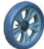
NAME:6.5" 宽边轮 ITEM NO:XH6506 SIZE:161*41 配套:6.5" 备注:反面带刹车齿