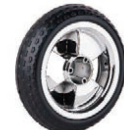
NAME:10" 多伊轮 ITEM NO:XH1024 SIZE:246*67 配套:8"10" 备注:双面轮 客户专用