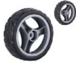
NAME:6" 三爪轮 ITEM NO:XH6052 SIZE:159*45 配套:6"9"12" 备注:反面无刹车齿 客户专用