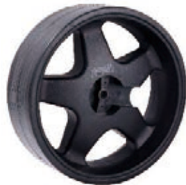
NAME:12" 高尔夫轮 ITEM NO:XH1201 SIZE:286*88 配套:6"10"12" 备注:反面无刹车齿,可配快拆及轮盖 客户专用