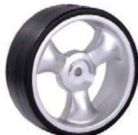
NAME:12" 按扣后轮 ITEM NO:XH1208 SIZE:254*80 配套:12" 备注:反面无刹车齿,可配快拆及轮盖 客户专用