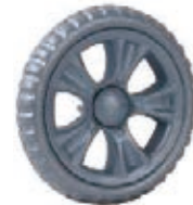
NAME:6.5" 贝思宝石轮 ITEM NO:XH6504 SIZE:166*31 配套: 6",6.5",7" 备注: 反面带刹车齿