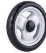
NAME:5.5" 汽车轮 ITEM NO:XH5511 SIZE:136*26 配套:5.5" 备注:反面带刹车齿 客户专用