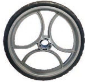
NAME:12" 三爪轮 ITEM NO:XH1229 SIZE:296*48 配套:6"9"12" 备注:双面轮 客户专用