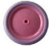
NAME:4.5" 娃娃前轮 ITEM NO:4512 SIZE:110*22 配套:4.5" 备注:反面带刹车齿