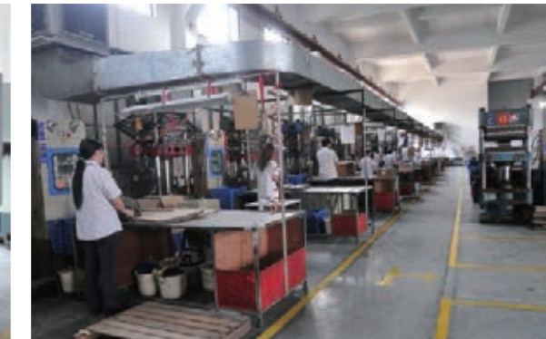
③ Eva Foam Workshop