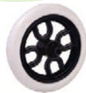
NAME:6" 梅花轮 ITEM NO:XH6001-1 SIZE:152*31 配套 :5".6" 备注 :双面轮