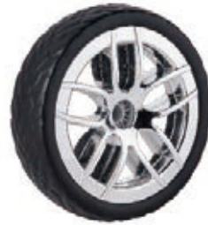
NAME:10" 启亚前轮 ITEM NO:XH1047 SIZE:260*70 配套:8.5"10" 备注:双面轮 客户专用