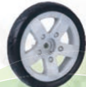
NAME:6" 贝驰嘉轮 ITEM NO:XH6041 SIZE:150*30 配套:6" 备注:反面带刹车齿