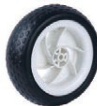
NAME:8" 三进轮 ITEM NO:XH8031 SIZE:206*70 配套:8" 备注:双面轮