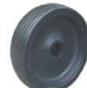
NAME:6" 高尔夫轮 ITEM NO:XH6004 SIZE:150*42 配套:6*10*12" 备注:双面轮