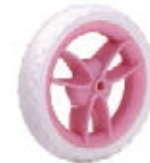
NAME:5" 三V轮 ITEM NO:XH5008 SIZE:127*29 配套:4.5",5" 备注:反面无刹车齿