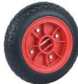
NAME:12" 方孔橡胶轮 ITEM NO:XH1214-1 SIZE:295*77 配套:8"10"12" 备注:双面轮,轮盖 客户专用