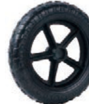
NAME:8" 五星越野轮 ITEM NO:XH8018 SIZE:205*39 配套:7"8"12" 备注:双面轮,可配轴承