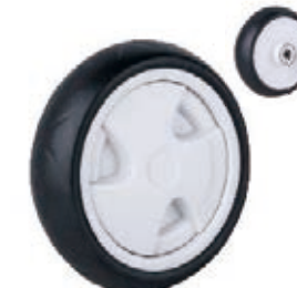
NAME:9" 至尊轮 ITEM NO:XH9012 SIZE:232*64 配套:9"11" 备注:反面无刹车齿 客户专用