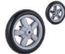
NAME:4.2" 菊花轮 ITEM NO:XH4520 SIZE:105*28 配套:4.2" 备注:反面带刹车齿