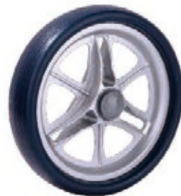
NAME:11" 跑车轮 ITEM NO:XH1101 SIZE:266*57 配套:8.5"11" 备注:反面带刹车齿,可配辅助齿,带快拆