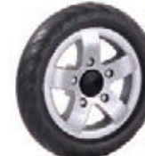
NAME:6" 贝驰元宝轮 ITEM NO:XH6024-2 SIZE:151*30 配套:6" 备注:反面带刹车齿