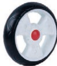
NAME:8" 三叶轮 ITEM NO:XH8015 SIZE:200*53 配套:8" 备注:反面带刹车齿 客户专用