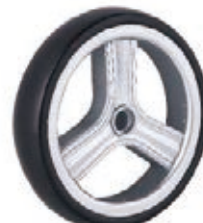
NAME:8" 双面三菱轮 ITEM NO:XH8036 SIZE:202*42 备注:双面轮,配轴承