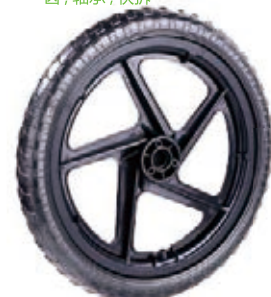
NAME:16" 越野轮 ITEM NO:XH1601 SIZE:393*42 配套:14"16" 备注:可做双面轮,配轴套,轴承,可配充气胎