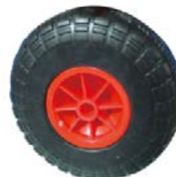
NAME:10" 空心厚胎 ITEM NO:XH1023 SIZE:250*80 配套:10" 备注:双面轮