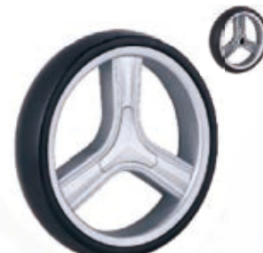
NAME:10" 三菱轮(轴承) ITEM NO:XH1043 SIZE:254*51 备注:反面无刹车齿,需配辅助齿,可配轴承