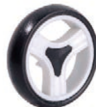
NAME:7" 三菱轮 ITEM NO:XH7023 SIZE:167*36 备注:反面带刹车齿