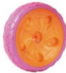
NAME:9" 太阳轮 ITEM NO:XH9009 SIZE:228*58 配套:9"10" 备注:反面无刹车齿