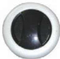
NAME:6.5" 永鑫轮 ITEM NO:XH6510 SIZE:162*36 配套:6.5" 备注:反面带刹车齿