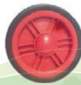
NAME:5" 米高轮 ITEM NO:XH5015 SIZE:127*29.5 配套 :5" 备注 :双面轮