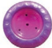
NAME:4.5" 八字胖轮 ITEM NO:XH4501-2 SIZE:114*31 配套:4.5" 备注:反面带刹车齿