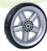
NAME:6.5" 水车轮 ITEM NO:XH6509 SIZE:164*35 配套:6.5"7.5" 备注:双面轮