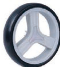
NAME:8" 三菱轮 ITEM NO:XH8027 SIZE:202*42 备注:反面带刹车齿