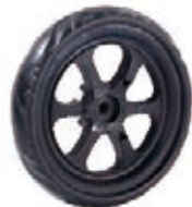
NAME:6.5" 瘦轮 ITEM NO:XH6501 SIZE:166*33 配套:6.5" 备注:反面带刹车齿