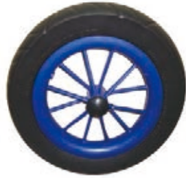
NAME:12" 仿钢丝发泡轮 ITEM NO:XH1202 SIZE:308*48 配套:12" 备注:可做双面轮,可配辅助齿,轴承,快拆