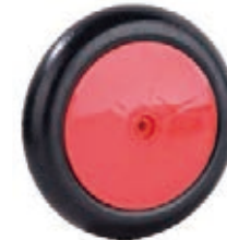
NAME:205 轮 ITEM NO:XH8007 SIZE:205*35 配套 :8" 备注 :反面无刹车齿