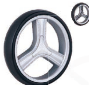
NAME:10" 三菱轮 ITEM NO:XH1032 SIZE:254*51 备注:反面带刹车齿