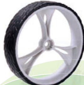
NAME:12" 三寰轮 ITEM NO:XH1217 SIZE:305*67 配套:8"12" 备注:双面轮 客户专用