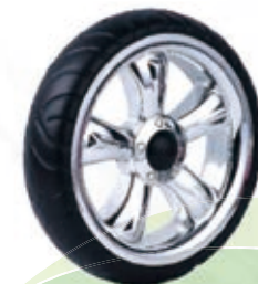
NAME:10" 贝奇轮 ITEM NO:XH1007 SIZE:258*62 配套:10" 备注:反面带刹车齿, 可配辅助齿,快拆