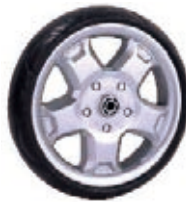
NAME:7" 五华轮 ITEM NO:XH7021 SIZE:176*38 配套:6",7",9" 备注:反面无刹车齿