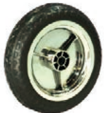
NAME:8.5" 三琪轮 ITEM NO:XH8503 SIZE:216*54 配套:8"10" 备注:双面轮 可配快拆 客户专用