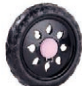
NAME:6" 花瓣轮 ITEM NO:XH6039 SIZE:152*34 配套:6" 备注:反面无刹车齿,带快拆