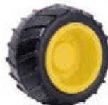
NAME:4" 宽齿轮 ITEM NO:XH4003 SIZE:96*40 配套 :3",4" 备注 :反面无刹车齿 客户专用