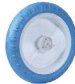
NAME:11" 蓝猫轮 ITEM NO:XH1102 SIZE:268*53 配套:10"11" 备注:双面