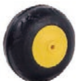
NAME:4.5" 脚板轮 ITEM NO:XH4510 SIZE:110*56 配套 :4.5" 备注 :反面无刹车齿 客户专用