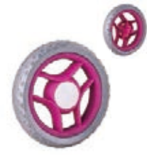
NAME:4.5" 柳叶轮 ITEM NO:XH4518 SIZE:114*28 配套:4.5" 备注:反面无刹车齿