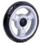
NAME:6" 三华轮 ITEM NO:XH6038 SIZE:148*34 配套:6",7",9" 备注:反面带刹车齿