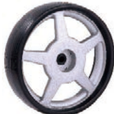
NAME:10" 铝框轮 ITEM NO:XH1020 SIZE:252*87 配套:10" 备注:反面无刹车齿,配轴套