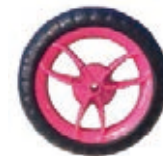
NAME:4.5" 三V宝石轮 ITEM NO:XH4525 SIZE:117*25 配套:4.5",6" 备注:双面轮