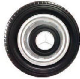
NAME:10.5" 奔驰轮 ITEM NO:XH1109 SIZE:268*70 配套:10.5" 备注:客户专用