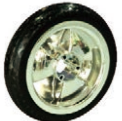
NAME:10" 三琪轮 ITEM NO:XH1037 SIZE:256*65 配套:8"10" 备注:双面轮 客户专用