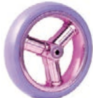
NAME:7" 三柱前轮 ITEM NO:XH7027 SIZE:182*42 备注: 双面轮