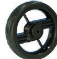
NAME:7" 幻影2#轮 ITEM NO:XH7035 SIZE:174*41 配套:7",10" 备注:双面轮 客户专用