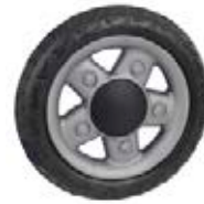
NAME:6" 吉普轮 ITEM NO:XH6032-1 SIZE:150*28 配套:6" 备注:反面带刹车齿