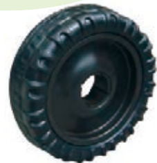
NAME:8" 乾坤轮 ITEM NO:XH8005 SIZE:196*93 配套:8" 备注:双面轮