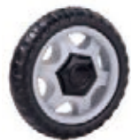
NAME:4.5" 雪花轮 ITEM NO:XH4503 SIZE:115*25 配套: 4.5",5",6" 备注: 反面带刹车齿