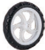
NAME:4.5" 旋转轮 ITEM NO:XH4524 SIZE:114*23 配套:4.5" 备注:双面轮