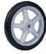
NAME:5.5" 五星轮 ITEM NO:XH5006 SIZE:139*20 配套:5.5" 备注:反面带刹车齿 客户专用