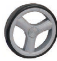
NAME:6.5" 三倍后轮 ITEM NO:XH6520 SIZE:165*31 配套:6.5"前,6.5"后 备注:反面带刹车齿 客户专用