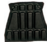
NAME:大靠背 ITEMNO:XH0005 SIZE:300*322