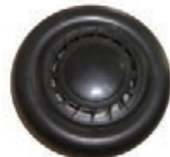
NAME:6" 顿力轮 ITEM NO:XH6042 SIZE:152*37 配套:6" 备注:反面带刹车齿