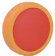
NAME:6" 娃娃轮 ITEM NO:XH6016-1 SIZE:148*35 配套:6" 备注:反面带刹车齿