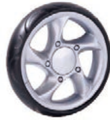
NAME:9" 宾利轮 ITEM NO:XH9002 SIZE:228*41 配套:6",7",8",9" 备注:反面带刹车齿