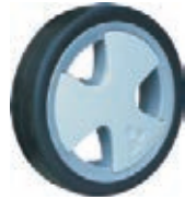
NAME:6" 帅轮 ITEM NO:XH6014 SIZE:148*35 配套:6" 备注:反面带刹车齿 客户专用