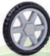
NAME:6" 雪花轮 ITEM NO:XH6005 SIZE:151*30 配套: 4.5",5",6" 备注: 反面带刹车齿