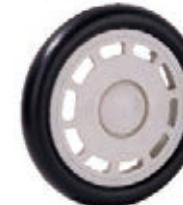
NAME:7.5" 兴业轮 ITEM NO:XH7020 SIZE:192*32 配套:7.5" 备注:反面带刹车齿 客户专用