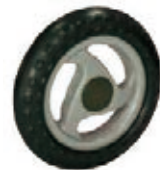
NAME:5.5" 三角轮 ITEM NO:XH5504 SIZE:140*32 配套:5.5" 备注:反面无刹车齿