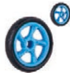
NAME:6" 健腹轮 ITEM NO:XH6059 SIZE:150*30 配套:6" 备注:反面无刹车齿