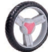
NAME:6" 三峰轮 ITEM NO:XH6011 SIZE:153*34 配套: 6",7" 备注: 反面带刹车齿