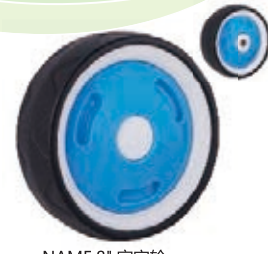
NAME:8" 家宝轮 ITEM NO:XH8034 SIZE:202*60 配套:8"10" 备注:反面无刹车齿 客户专用