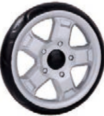
NAME:9" 五华轮 ITEM NO:XH9006 SIZE:228*41 配套:6",7",9" 备注:反面带刹车齿,快拆功能