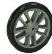
NAME:6" 星钻双面轮 ITEM NO:XH6056 SIZE:150*30 配套:6"前,6"后,7"后 备注:双面轮