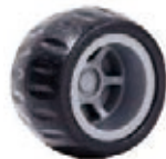
NAME:3" 月牙轮 ITEM NO:XH3003 SIZE:80*42 配套 :3",4" 备注 :反面无刹车齿 客户专用