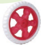
NAME:6" 娃娃宝石轮 ITEM NO:XH6007-1 SIZE:150*30 配套:6" 备注:反面无刹车齿