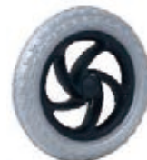
NAME:6" 越野轮 ITEM NO:XH6015 SIZE:166*35 配套:6"8" 备注:反面可带刹车齿,配快拆