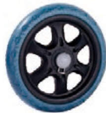
NAME:8.5" 永葵轮 ITEM NO:XH8501 SIZE:208*40 配套:8.5"11" 备注:反面带刹车齿,带快拆