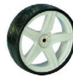
NAME:10" F2 后宽轮 ITEM NO:XH1015 SIZE:248*110 配套:5.5*10" 备注:反面无刹车齿,可配辅助齿,快拆,轮盖 客户专用