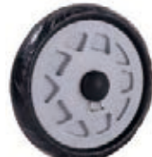
NAME:6.5" 行李轮 ITEM NO:XH6502 SIZE:163*33 配套:6.5" 备注:反面无刹车齿,带快拆