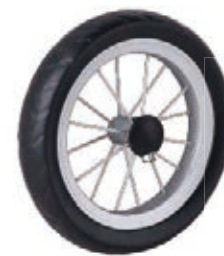
NAME:10" 钢丝发泡轮 ITEM NO:XH1013 SIZE:246*44 配套:10" 备注:双面轮,可带快拆