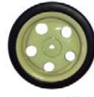
NAME:7" 五孔轮 ITEM NO:XH7017 SIZE:173*24 配套:6"7" 备注:反面带刹车齿 客户专用