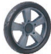
NAME:6" 贝嘉轮 ITEM NO:XH6045 SIZE:150*29.5 配套: 6",7" 备注: 反面带刹车齿