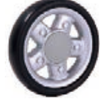
NAME:5.5" 吉普平轮 ITEM NO:XH5503-2 SIZE:138*27 配套:5.5" 备注:反面带刹车齿