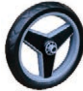
NAME:6" 奔驰双面轮 ITEM NO:XH6057 SIZE:150*29.5 配套: 6" 前,6" 后 备注: 双面轮客户专用