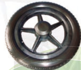
NAME:12" 老人车轮 ITEM NO:XH1213 SIZE:302*46 配套:7"8"12" 备注:双面轮,可做单轮,可配轴承及轮盖