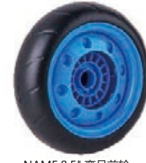
NAME:8.5" 弯月前轮 ITEM NO:XH8504 SIZE:216*44 配套:8.5"前,8.5"后 备注:双面轮 客户专用