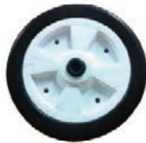
NAME:9.65" 机械轮 ITEM NO:XH1045 SIZE:245*60 配套:7.2*9.65" 备注:双面轮,带轴套 客户专用