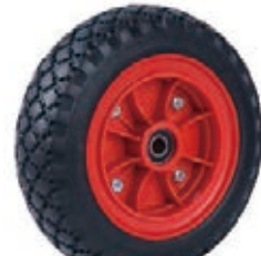
NAME:10" 橡胶轮 ITEM NO:XH1008 SIZE:258*79 配套:8"10"12" 备注:双面轮,配轴承,轮盖