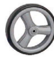
NAME:6.5" 三倍前轮 ITEM NO:XH6519 SIZE:165*31 配套:6.5"前,6.5"后 备注:双面轮 客户专用