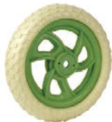
NAME:10" 群兴轮 ITEM NO:XH1010 SIZE:250*52 配套:8"10" 备注:双面轮