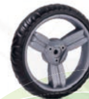
NAME:7" 三峰轮 ITEM NO:XH7015 SIZE:179*35 配套: 6",7" 备注: 反面带刹车齿