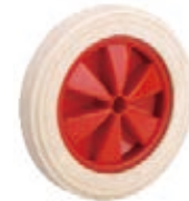
NAME:6" 扇叶大白轮 ITEM NO:XH6023 SIZE:150*35 配套:5"6" 备注:双面轮,可配轴卡