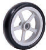
NAME:5.5" 五柱轮 ITEM NO:XH5510 SIZE:136*25 配套:5.5*8" 备注:双面轮,可配轴承