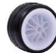
NAME:5.5"105P3 前轮 ITEM NO:XH5005 SIZE:143*75 配套:5.5*10" 备注:双面轮,可配轴承 客户专用