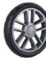
NAME:7" 星钻单面轮 ITEM NO:XH7034 SIZE:178*35 配套:6"前,6"后,7"后 备注:反面无刹车齿,带快拆