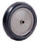
3.8" 平面轮 ITEM NO:XH3801-1 SIZE:97*21 配套:3.8" 备注:反面无刹车齿