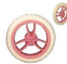
NAME:6" 三V宝石轮 ITEM NO:XH6060 SIZE:151*30 配套:4.5",6" 备注:反面无刹车齿