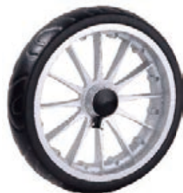
NAME:11" 爱玛轮 ITEM NO:XH1103 SIZE:282*63 配套:11" 备注:反面带刹车齿,可配辅助齿,快拆 客户专用