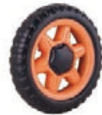
NAME:5" 六角雪花轮 ITEM NO:XH5013 SIZE:122*30 配套: 4.5",5",6" 备注: 反面带刹车齿