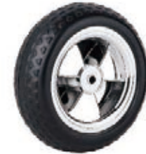
NAME:8" 多伊轮 ITEM NO:XH8037 SIZE:206*73 配套:8"10" 备注:双面轮 客户专用