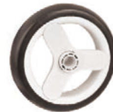
NAME:8" T08 后轮 ITEM NO:XH8039 SIZE:204*45 配套:8",10" 备注:双面轮 客户专用