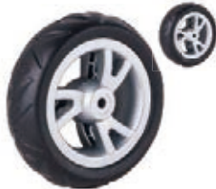
NAME:7" 蟹脚轮 ITEM NO:XH7033 SIZE:182*54 配套:7"9" 备注:反面无刹车齿 客户专用