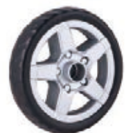
NAME:6" 思明轮 ITEM NO:XH6053 SIZE:153*31 配套:6",12" 备注:双面轮