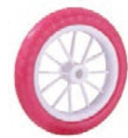
NAME:7.5" 明门轮 ITEM NO:XH8001 SIZE:189*34 配套:7.5" 双 .7.5" 单 .10" 备注:反面无刹车齿,可配快拆