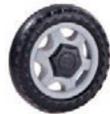
NAME:5" 雪花胖轮 ITEM NO:XH5010 SIZE:122*30 配套: 4.5",5",6" 备注: 反面带刹车齿