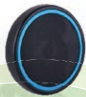
NAME:6.5" 平面后轮 ITEM NO:XH6515 SIZE:164*31 配套:5",6.5"前,6.5"后 备注:反面带刹车齿