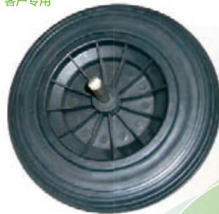
NAME:14" 大胖轮 ITEM NO:XH1402 SIZE:3503*82 配套:14" 备注:双面轮,可配铁轴