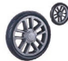
NAME:6" 星钻单面轮 ITEM NO:XH6054 SIZE:150*30 配套:6"前,6"后,7"后 备注:反面无刹车齿,带快拆