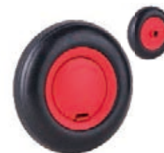
NAME:6.5"NCT 轮 ITEM NO:XH6516 SIZE:163*41 配套 :6.5" 备注 :反面无刹车齿, 带轴卡