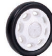
NAME:7" 宾士轮 ITEM NO:XH7014 SIZE:177*36 配套:6"7" 备注:反面带刹车齿 客户专用