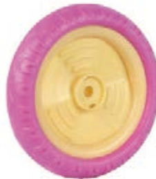
NAME:10" 蓝猫轮 ITEM NO:XH1016 SIZE:250*50 配套:10"11" 备注:反面无刹车齿, 配轮盖