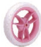
NAME:4.5" 三V轮 ITEM NO:XH4516 SIZE:114*25 配套:4.5",5" 备注:双面轮