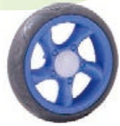
NAME:6" 宾利轮 ITEM NO:XH6027 SIZE:146*34 配套:6",7",8",9" 备注:反面带刹车齿