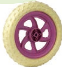
NAME:8" 群兴轮 ITEM NO:XH8009 SIZE:206*46 配套:8"10" 备注:反面无刹车齿