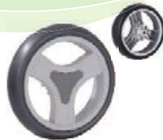
NAME:5" 三菱轮 ITEM NO:XH5009 SIZE:125*30 配套:5",6",6.5"前,7",8"前, 8"后,10",10"