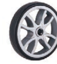
NAME:7" 太空轮 ITEM NO:XH7036 SIZE:180*36 配套:7",12" 备注:双面轮 客户专用