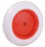
NAME:4.5" 中胖轮 ITEM NO:XH4502 SIZE:115*28 配套:4.5" 备注:反面带刹车齿