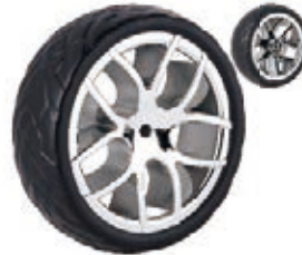
NAME:8.5" 启亚后轮 ITEM NO:XH8506 SIZE:216*65 配套:8.5"10" 备注:反面无刹车齿 客户专用