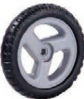
NAME:7" 吉利轮 ITEM NO:XH7011 SIZE:178*32 配套:6",6.5",7" 备注:反面无刹车齿,可配快拆