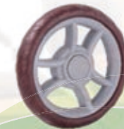
NAME:6" 三弧轮 ITEM NO:XH6028 SIZE:152*30 配套:6" 备注:反面无刹车齿