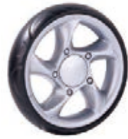
NAME:7" 宾利轮 ITEM NO:XH7009 SIZE:176*40 配套:6",7",8",9" 备注:反面带刹车齿