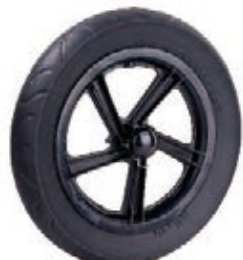
NAME:12" 葆葆轮 ITEM NO:XH1205 SIZE:308*48 配套:12" 备注:可做双面轮,配刹车齿,配快拆,轴承