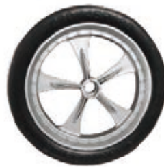
NAME:9" 冰晶轮 ITEM NO:XH9005 SIZE:220*45 配套:9" 备注:双面轮,可配轴套