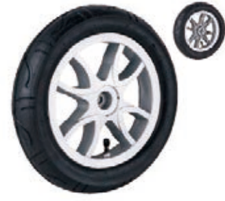
NAME:12" 太空轮 ITEM NO:XH1224 SIZE:306*52 配套:7",12" 备注:反面无刹车齿,可配辅助齿.快拆.可配轴承.