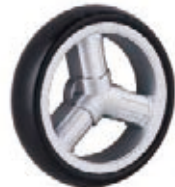
NAME:6" 三柱轮 ITEM NO:XH6046 SIZE:152*36 备注: 单面轮, 反面无刹车齿需配辅助齿