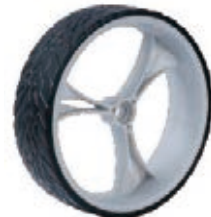
NAME:8" 三寰轮 ITEM NO:XH8026 SIZE:210*60 配套:8"12" 备注:反面无刹车齿 客户专用