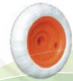
NAME:4.5" 8 字轮 ITEM NO:XH4511 SIZE:114*32 配套:4.5" 备注:反面无刹车齿