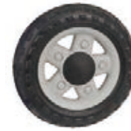
NAME:6" 吉普越野轮 ITEM NO:XH6032-2 SIZE:160*34 配套:6" 备注:反面带刹车齿