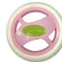
NAME:7.5" X轮 ITEM NO:XH7501 SIZE:192*34 配套:5.5",6",7.5" 备注:反面无刹车齿