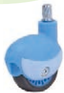
NAME:2" 方向轮组 ITEM NO:XH2001 SIZE:56*25 配套 :2" 备注 :双面轮