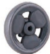
NAME:H888 ITEM NO:XH4519 SIZE:98*19 配套 :3.8" 备注 :反面带刹车齿