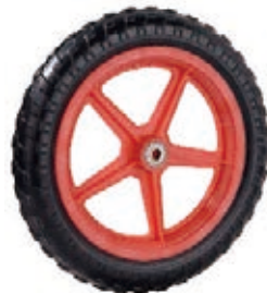
NAME:12" 五星发泡轮 ITEM NO:XH1203 SIZE:292*48 配套:12" 备注:双面轮,可配轴承