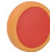
NAME:6" 娃娃轮 ITEM NO:XH6016-1 SIZE:148*35 配套 :6" 备注 :反面带刹车齿