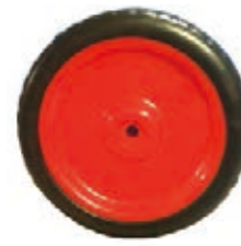
NAME:8" 双纹轮 ITEM NO:XH8032 SIZE:198*70 配套:8" 备注:双面轮 客户专用