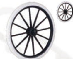
NAME:10" 明门轮 ITEM NO:XH1048 SIZE:252*21 配套:7.5" 双 .7.5" 单 .10" 备注:反面无刹车齿,可配快拆