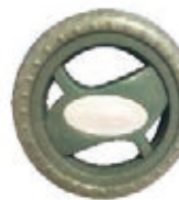
NAME:6" X轮 ITEM NO:XH6040 SIZE:156*30 配套:5.5",6",7.5" 备注:反面无刹车齿