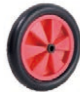
NAME:6" 160 轮 ITEM NO:XH6006 SIZE:150*29 配套:5"6" 备注:双面轮,可配轴卡