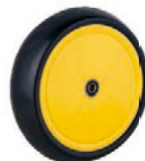
NAME:9" 驱动轮 ITEM NO:XH9014 SIZE:234*66 配套:9"11" 备注:反面无刹车齿 客户专用