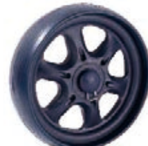
NAME:8" 和平轮 ITEM NO:XH8003 SIZE:196*46.5 配套:8" 备注:反面带刹车齿,带快拆