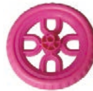
NAME:6" 梅花轮 ITEM NO:XH6001-2 SIZE:152*29 配套 :5".6" 备注 :双面轮