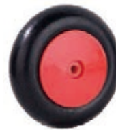
NAME:6" 145 轮 ITEM NO:XH6021 SIZE:145*40 配套 :6" 备注 :反面无刹车齿