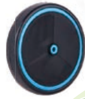
NAME:6.5" 平面前轮 ITEM NO:XH6514 SIZE:164*31 配套:5",6.5"前,6.5"后 备注:双面轮