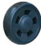
NAME:5" 美克轮 ITEM NO:XH5003 SIZE:123*36 配套:5*10" 备注:反面无刹车齿,带轮盖