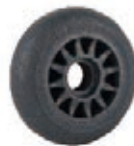
NAME:3" PU 轮 ITEM NO:XH3004 SIZE:80*24 配套 :3" 备注 :双面轮