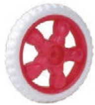
NAME:7" 风火宝石轮 ITEM NO:XH7003 SIZE:176*31 配套:6",7" 备注:反面带刹车齿