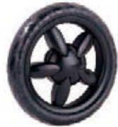
NAME:6" 菊花轮 ITEM NO:XH6019 SIZE:152*28 配套:6" 备注:反面带刹车齿