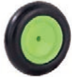
NAME:4.5" 小胖轮 ITEM NO:XH4501 SIZE:114*31 配套:3",4.5" 备注:反面带刹车齿