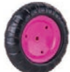
NAME:4.5" 钻石胖轮 ITEM NO:XH4501-1 SIZE:114*31 配套:4.5" 备注:反面带刹车齿