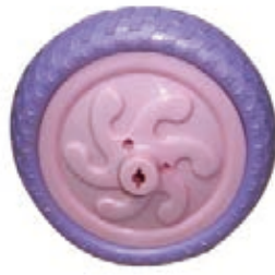
NAME:10" 启乐轮 ITEM NO:XH1011 SIZE:250*52 配套:8"10" 备注:双面轮