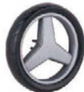
NAME:6" 奔驰单面轮 ITEM NO:XH6056 SIZE:150*29.5 配套: 6" 前,6" 后 备注: 反面带刹车齿客户专用