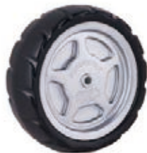
NAME:8"ST 轮 ITEM NO:XH8035 SIZE:202*64 配套:8"9" 备注:双面轮 客户专用