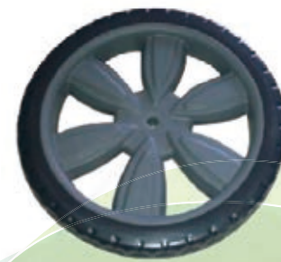
NAME:12" 通用轮 ITEM NO:XH1216 SIZE:308*52 配套:12" 备注:反面无刹车齿