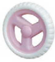
NAME:6.5" 吉利轮 ITEM NO:XH6505 SIZE:165*30 配套:6",6.5",7" 备注:反面无刹车齿,可配快拆