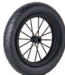
NAME:12" 华港轮 ITEM NO:XH1209 SIZE:308*48 配套:12" 备注:双面轮