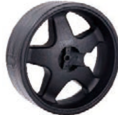
NAME:10" 高尔夫扁轮 ITEM NO:XH1006 SIZE:256*87 配套:6"10"12" 备注:反面无刹车齿,可配快拆及轮盖 客户专用