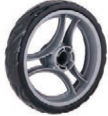
NAME:9" 三爪轮 ITEM NO:XH9018 SIZE:230*45 配套:6"9"12" 备注:双面轮 客户专用