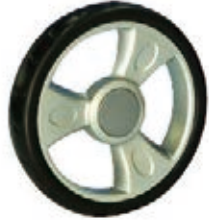
NAME:8" 三博轮 ITEM NO:XH8033 SIZE:202*35 配套:8",9" 备注:反面带刹车齿