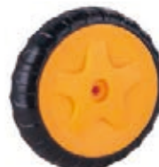
NAME:T55900 轮 ITEM NO:XH6058 SIZE:148*30 配套 :6" 备注 :反面无刹车齿 客户专用