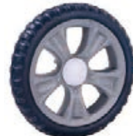
NAME:7" 贝思宝石轮 ITEM NO:XH7006 SIZE:177*32 配套: 6",6.5",7" 备注: 反面带刹车齿